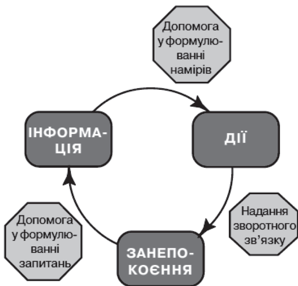
Рис. 3. Способи стимулювання навчання учнів

Побудований на зазначених вище засадах предмет «Уроки для сталого розвитку» покликаний допомогти учням не тільки уявляти своє бажане майбутнє, а й активно його наближати. Таким чином, учні діють не через страх перед наслідками екологічних проблем, а через бажання жити в кращому світі.