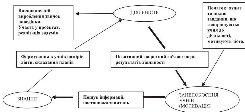
Рис. 4. Модель навчання в педагогіці «емпауермент»

Отже, концептуальні засади курсу, засновані на педагогіці «емпауермент», можуть бути представлені схемою (рис. 4).